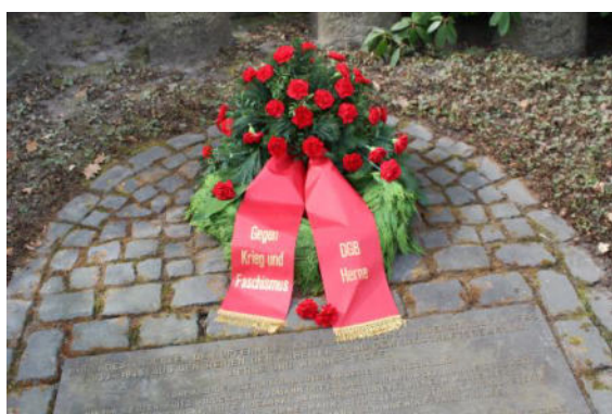
Seit 25 Jahren ehrendes Mahnen und Gedenken des DGB-Herne

macht es ungeniert vor und in den NATO-Staaten wirken die gleichen Triebkräfte. Es ging und geht nicht nur in der Ukraine, um Interessen, Bodenschätze, um Einfluss-Sphären um Mehrwert und Profit. Darum trägt der Kapitalismus den Krieg in sich, wie die Wolke den Regen! (Jean Jaures)