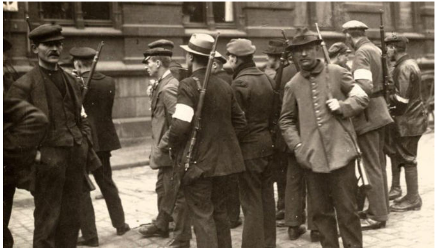
Frühjahr 1920 – Gegen Knechtschaft und Krieg. Die Arbeiter bewaffnen sich ...

sich auch im Frühjahr 1920! Immer häufiger kommt es im Industriegebiet zu bewaffneten Auseinandersetzungen zwischen Militär, Polizei und Arbeitern. Es bildet sich, quasi im Zuge proletarischer Selbstermächtigung, koordiniert von den Räten in Städten und Schachanlagen, eine Rote Ruhrarmee die bis zu 100.000 Kämpfer umfasst und die Regierungstruppen anfangs erfolgreich zurückschlägt. Aber das Blatt wendet sich und die Rote Ruhrarmee hält der geballten militärischen und mit schweren Kriegsgeschützen ausgestatteten Übermacht nicht stand.