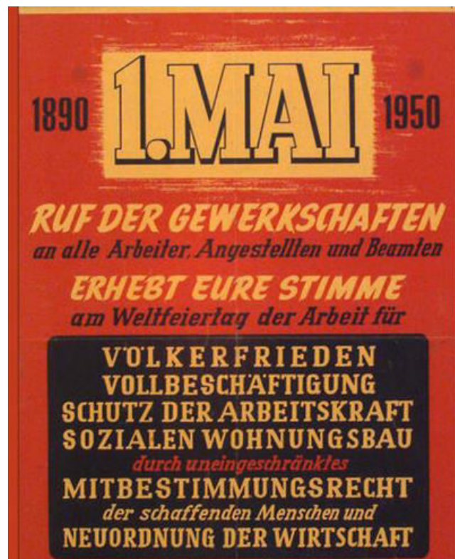
Mai-Plakat des DGB 1950

Geschichte! Alles unter der Fahne der Verteidigung von „Demokratie, Freiheit, Menschenrechten“ und „unseren Werten“. Wenn von Freiheit die Rede ist meinen sie Ellenbogen- und Gewerbefreiheit. Und wenn von „Werten“ die Rede ist, dann sollten wir es sprichwörtlich nehmen. Trump