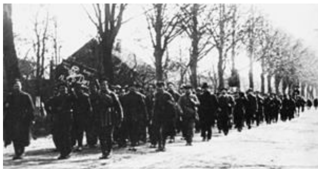
Abteilung der Roten Ruhrarmee auf dem Marsch

Die zuvor geflohene und jetzt nach Berlin zurückgekehrte Ebert-Regierung setzt nun die Reichswehr, Freikorps und Sicherheitspolizei (darunter Teile der Putsch-Truppen!) zum Abwürgen des Streiks und gegen ihre Retter ein. Elender und ruchloser Verrat, wie schon 1918/19 wiederholen