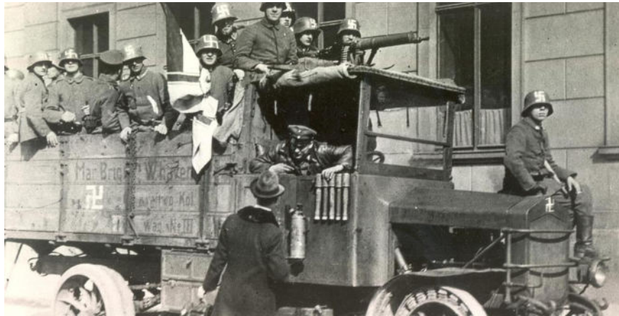
Gegenrevolutionäre Freikorps-Einheit mit Hakenkreuz gekennzeichnet

Seit 1918/19 fehlt auf Seiten der Arbeiter, immer noch ein organisierendes Zentrum und eine zielklare Führung. Es fehlt an einer revolutionären Massenpartei. Anfang April 1920 werden Herne und Wanne-Eickel von Reichswehr besetzt und es folgt hier wie im gesamten Revier durch diese ein mörderischer Rachefeldzug in den Arbeiterquartieren. Am Ende zählt man auf Seiten der Arbeiter über 1000 Tote, im Kampf gefallen aber auch häufig standrechtlich erschossen oder auf dem Rückzug viehisch abgeschlachtet! Die Erbitterung und der Zorn in der arbeitenden Bevölkerung ist natürlich enorm.