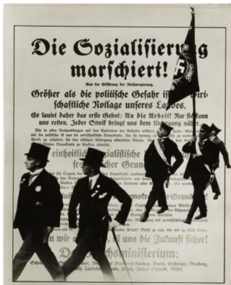
J. Heartfield - Spottplakat