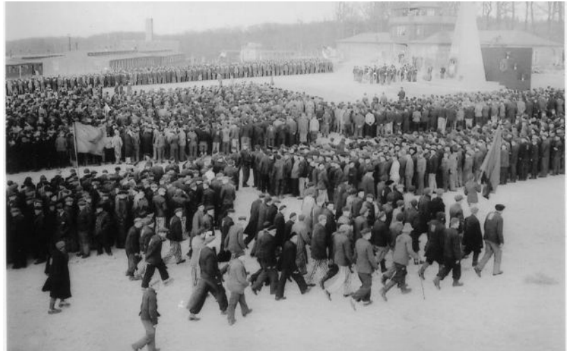
Befreite Häftlinge bei der ersten Gedenkfeier für die Toten des KZ Buchenwald auf dem Appellplatz.

Der Aufbau einer neuen Welt des Friedens und der Freiheit ist unser Ziel. Das sind wir unseren gemordeten Kameraden, ihren Angehörigen schuldig.“ 3